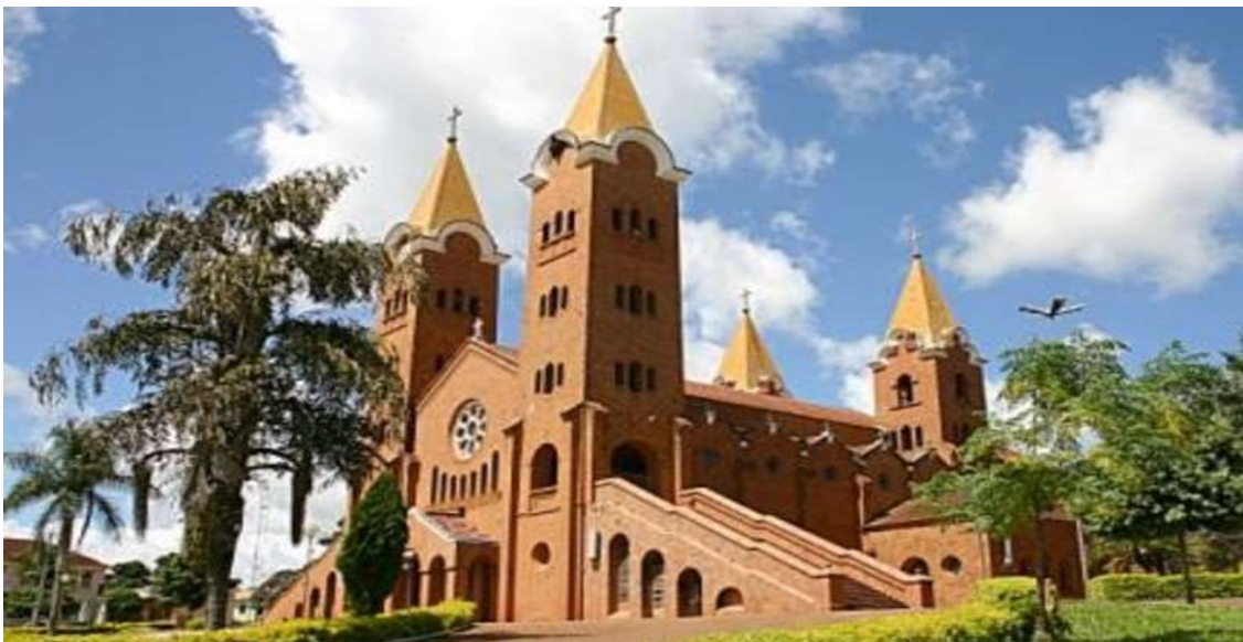
Santuário Nossa Senhora da Abadia – Romaria/MG – Atual

Em 1920, a paróquia de Estrela do Sul recebeu convite da Diocese de Uberaba para participar das Bodas de Ouro. Agora, em 2020, a Festa de Nossa Senhora da Abadia comemora o Jubileu de 150 anos. A fé e a devoção do povo estrelassulense à Nossa Senhora da Abadia continua forte. Devido à pandemia do coronavírus ( COVID-19 ), a comemoração será a distância, mantendo a mesma fé de sempre.