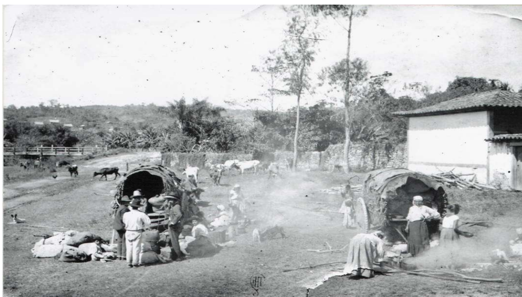
Romeiros de Estrela do Sul a caminho de Água Suja – Década de 1910

A cidade de Estrela do Sul surgiu da atividade garimpeira e seu crescimento considerável se deu na metade do século XIX, com a grande quantidade de diamantes encontrados. A partir daí várias povoações surgiram. Uma delas foi Água Suja, onde também foram descobertas minas de diamante. Com o tempo, veio a devoção à Nossa Senhora da Abadia e o lugar se tornou ponto alto de peregrinação a partir de 1870. Como as demais cidades, Estrela do Sul também passou a participar das romarias, anualmente, costume que já dura 150 anos. Quando o trajeto era precário, e passando por caminhos improvisados, os devotos de Estrela do Sul dirigiam a Água Suja em carros de bois, e por lá ficavam, até o final da festa. Os que dispunham de menos tempo faziam o trajeto em caminhada.