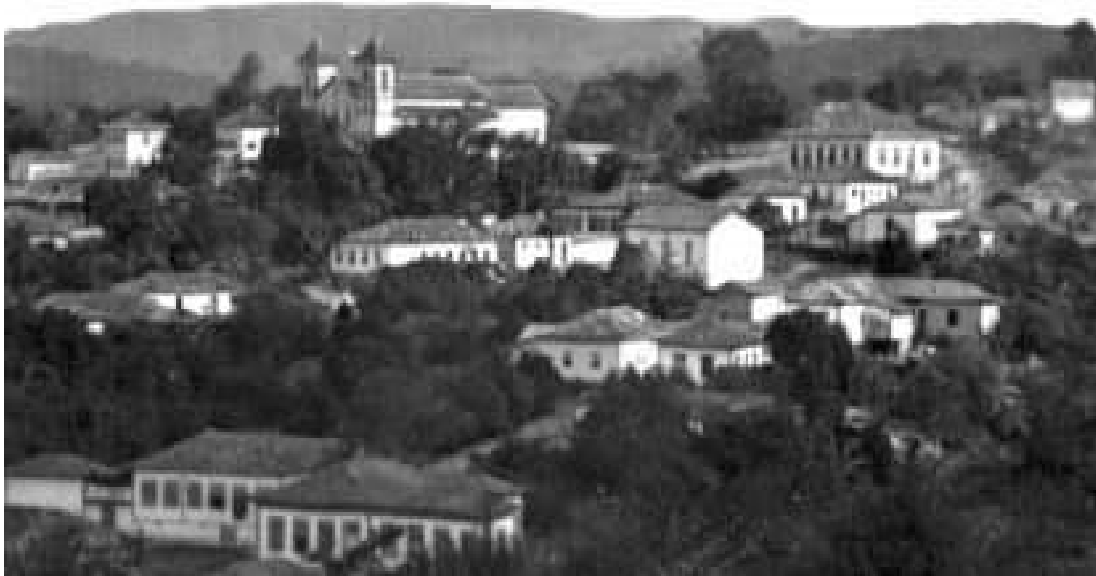
Estrela do Sul – 1901

O povoado de Água Suja nasceu no auge da mineração de diamantes da antiga Bagagem Diamantina e ficou sob a administração de Estrela do Sul até 1900. Com a criação do município de Monte Carmelo, naquele ano, Água Suja passou a pertencer a aquela cidade.