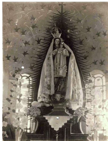
Cartão-postal - 1951

A cidade de Estrela do Sul surgiu da atividade garimpeira e seu crescimento considerável se deu na metade do século XIX, com a grande quantidade de diamantes encontrados. A partir daí várias povoações surgiram. Uma delas foi Água Suja, onde também foram descobertas minas de diamante. Com o tempo, veio a devoção à Nossa Senhora da Abadia e o lugar se tornou ponto alto de peregrinação a partir de 1870. Como as demais cidades, Estrela do Sul também passou a participar das romarias, anualmente, costume que já dura 150 anos. Quando o trajeto era precário, e passando por caminhos improvisados, os devotos de Estrela do Sul dirigiam a Água Suja em carros de bois, e por lá ficavam, até o final da festa. Os que dispunham de menos tempo faziam o trajeto em caminhada.